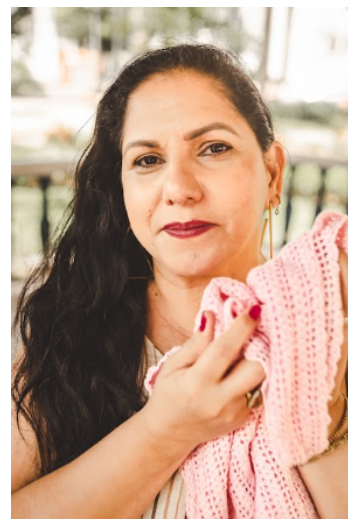
(Ensaio fotográfico do coletivo.).

Após meses de preparação, a exposição “Mulheres e História: memórias coletivas de mulheres do interior de MG”, gratuita e aberta ao público, aconteceu nos dias 30 e 31 de