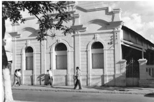
(Teatro Redenção)

Uma construção do início do século XX foi o lugar escolhido para a exposição fotográfica realizada pelo grupo de mulheres. Inaugurado em 1901, o Teatro Redenção recebeu esse nome do então presidente da Câmara Municipal de nossa cidade. Anos antes da Lei Áurea, em 1888, quando ainda era um estudante de medicina, o referido presidente libertou uma mulher escravizada que estava à venda naquele local e que chorava ante à ameaça de separação de seu filho. O estudante lembrou aos presentes que a Lei do Ventre Livre estava em vigor e comprou a carta de alforria, libertando a mulher escravizada. O teatro recebeu o nome de Redenção porque foi construído no mesmo lugar em que a escrava foi liberta.