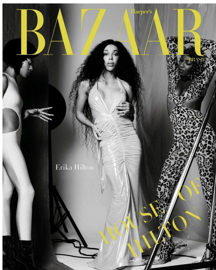
Figura 7 Erika Hilton como capa da revista Harper's Bazaar Brasil N° 140