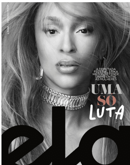
Figura 6 Erika Hilton capa da revista Ela (2024) do Dia Internacional da Mulher

Adriano Damas (2024), a capa da revista, essa que expõe sonhos (Aires 2022), apresenta Hilton como: “A deputada federal que defende união entre as mulheres” (Vanini, 2024), unindo moda, feminilidade e ativismo na mesma edição.