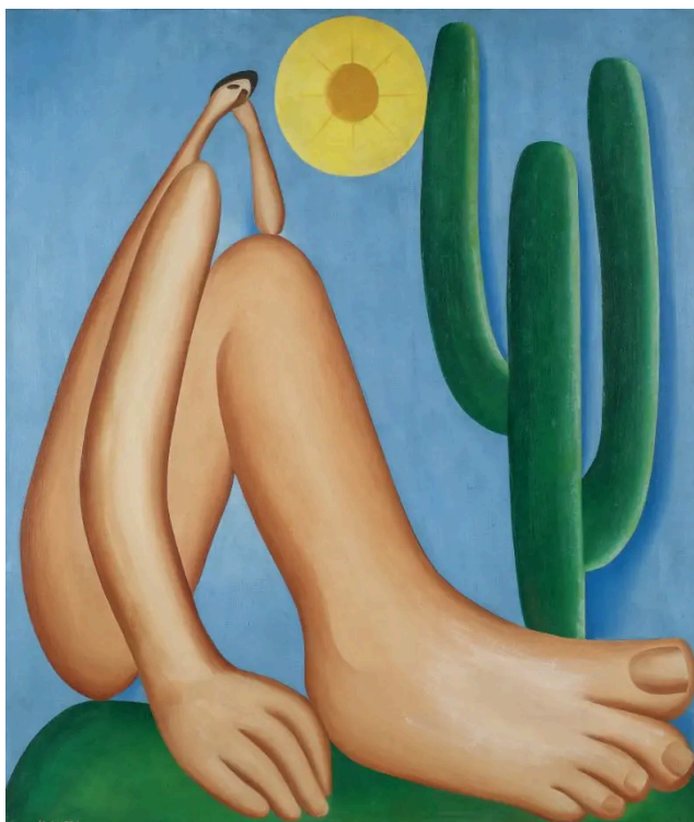
Figura 3 Abaporu (1928), de Tarsila do Amaral

No campo das representações midiáticas, reconhecendo que ângulos, planos, poses ou proximidade da câmera em que são realizadas performances fotográficas significam contextos, Erika posa em plano americano, permitindo maior visualização das suas expressões e do contexto em que sua imagem é associada naquele momento, indicando certa proximidade com o espectador. Com postura e posição corporal despojada, a foto de Erika remete à pintura “Abaporu” (Homem que come)”, de 1928, da artista Tarsila do Amaral, obra que marca o movimento Modernista no Brasil, que por meio do uso de elementos estéticos e formas únicas emerge o conceito de brasilidade, criando uma identidade cultural única (Silva, 2015). Isso corresponde também à identidade travesti, como trazido no primeiro capítulo deste texto, é uma identidade única e exclusiva do Brasil.