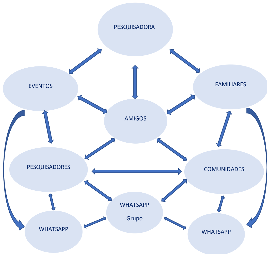
Figura 1 – Método Snowball Sampling