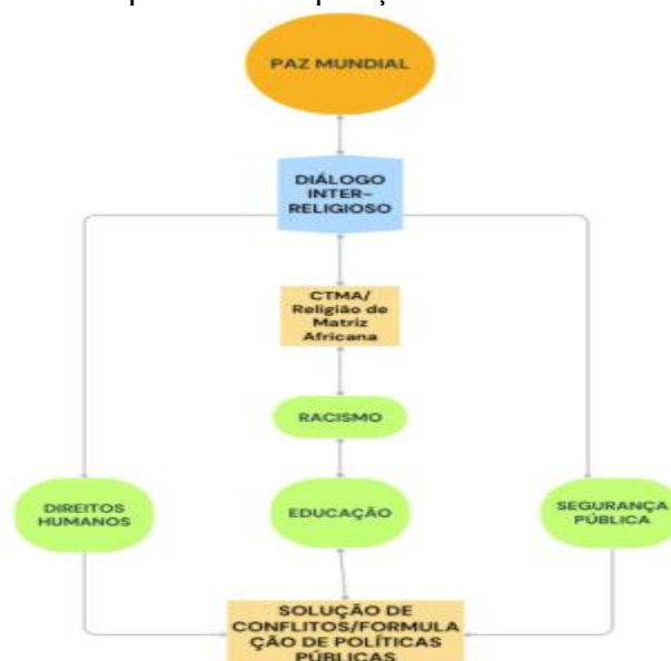
Figura 11 – Esquema da Proposição de Paz Mundial II