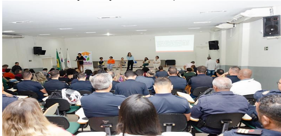
Figura 4 – Seminário Municipal: Respeito às Diferenças como Premissa da Política Pública

Desses encontros surgiram as proposições para dois seminários, sendo o primeiro realizado em agosto de 2023 e intitulado “Seminário Municipal: Respeito às Diferenças como Premissa da Política Pública”, com a finalidade de levar mais conhecimento e reflexão sobre a questão da diversidade no atendimento ao público. Foi um seminário voltado para os servidores e, embora o tema não fosse sobre intolerância religiosa às religiões de matriz africana, o assunto estava implícito no que tange à observância dos servidores públicos ao respeito às diferentes crenças que existem no município.