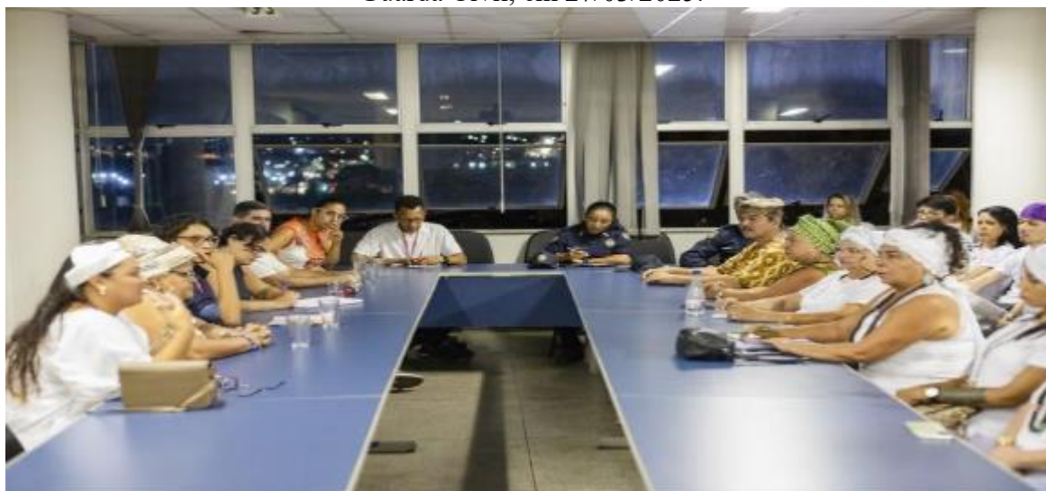
Figura 12 – Reunião para combate à intolerância religiosa, com membros das CTMA e da Guarda Civil, em 27/03/2025.

Secretaria de Direitos Humanos e Sociedade Civil, em uma postura de igualdade perante suas solicitações e demandas, de forma horizontal, sentados, com a finalidade de realizar uma escuta ativa e qualificada das principais lideranças das CTMA do município, “[...] já as minorias buscam, primeiramente, o reconhecimento de que também possuem direito e, posteriormente, mas concomitante, o exercício destes; o que move uma minoria é o impulso de transformação” (Siqueira; Castro, 2017, p. 115).