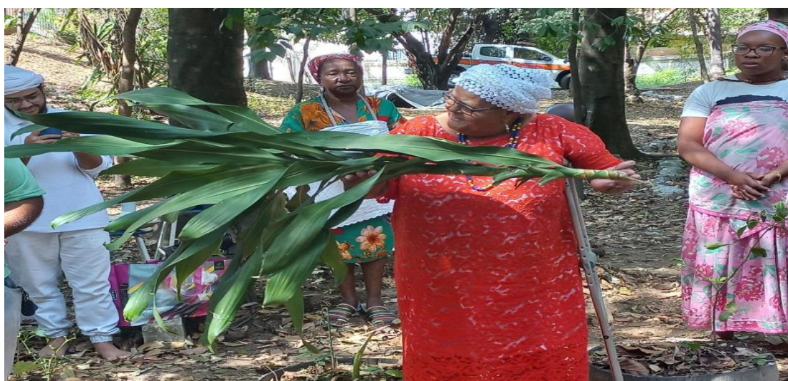
Figura 3 – Importância de Políticas Ambientais e da Preservação com as Lideranças Religiosas, em 21/08/2023

Por outro lado, a Secretaria de Defesa Social também tem um programa chamado “Telhado Verde”, idealizado pela Defesa Civil. Caracteriza-se por seu cunho ambiental e por atuar na prevenção de desastres ante problemas dessa natureza (Contagem, 2023). Ele tem como eixos norteadores alguns projetos, dentre eles, o “Jardim Sagrado”, que é executado intersetorialmente e busca resgatar culturas ecológicas que trazem benefícios tanto na gestão de riscos, quanto no resgate e na valorização da formação do povo brasileiro, por meio da participação das CTMA para demonstração de seus conhecimentos das religiões de matriz africana existentes no município.