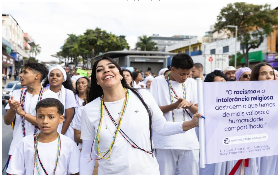
Figura 9 – 11º Marcha do Enfrentamento Contra o Racismo e a Intolerância Religiosa, em 17/05/2025