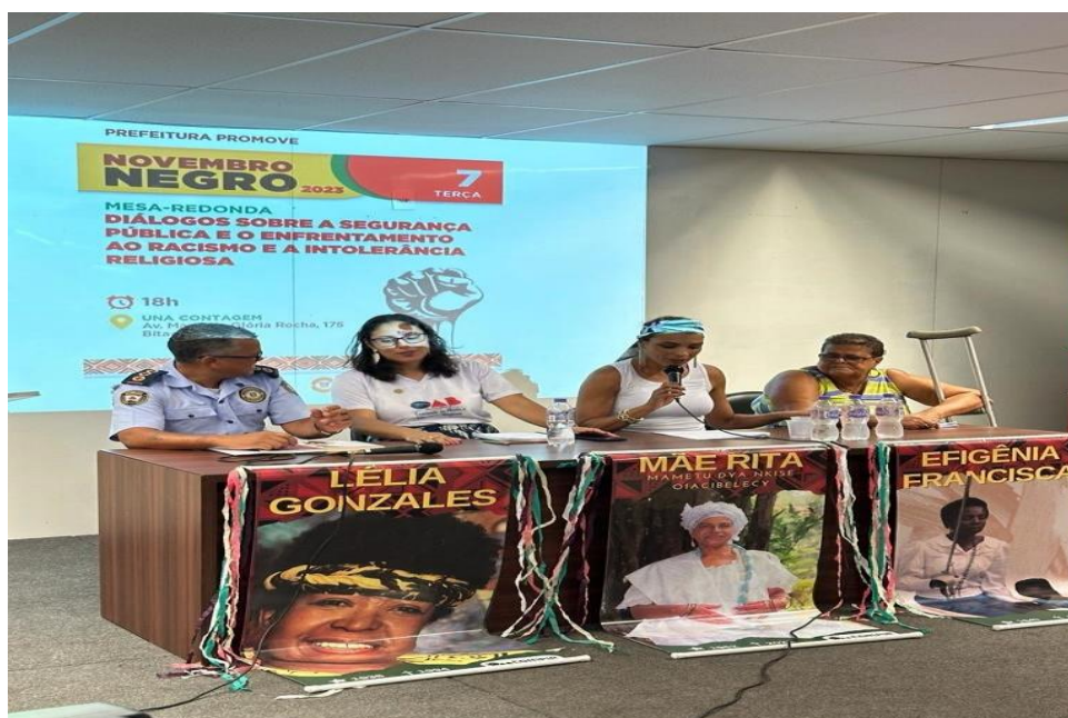
Figura 5 – Roda de Conversa: Diálogos sobre a Segurança Pública e o Enfrentamento ao Racismo e à Intolerância Religiosa