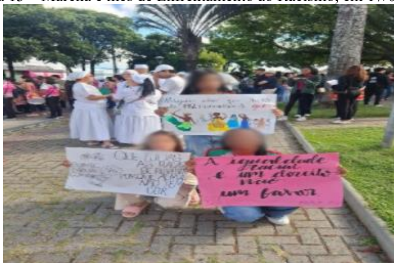
Figura 13 – Marcha e mês de Enfrentamento ao Racismo, em 17/05/2025

religiosidade e cultura, possui potencial como força motriz para a redução das desigualdades sociais entre os diferentes níveis econômicos. Dessa forma, é possível inferir que a educação constitui uma política pública fundamental para garantir o acesso aos bens econômicos produzidos pela sociedade, promovendo a inclusão social e a equidade.