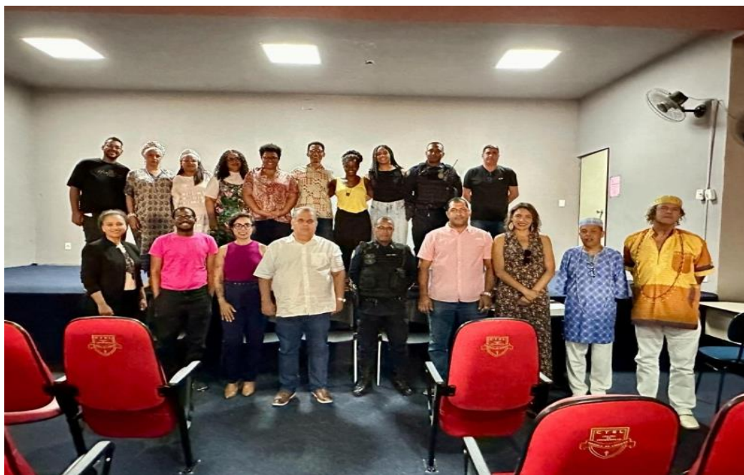
Figura 1 – Orientação de intervenção para Segurança Pública em casos de intolerância religiosa às religiões de matriz africana, em 10/02/2024 11