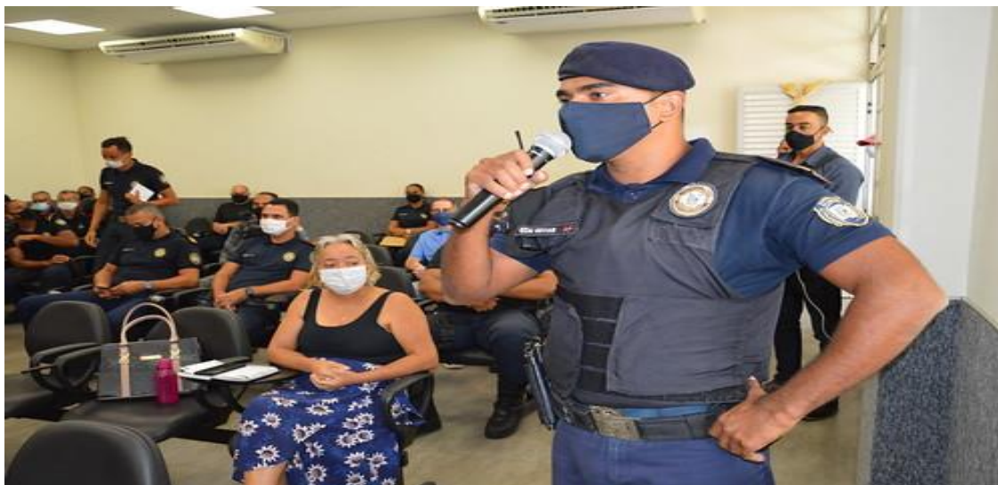
Figura 2 – Seminário de Segurança Pública e Igualdade Racial, em 19/11/2022

informações teóricas e práticas de como intervir em possíveis situações concretas de intolerância religiosa.