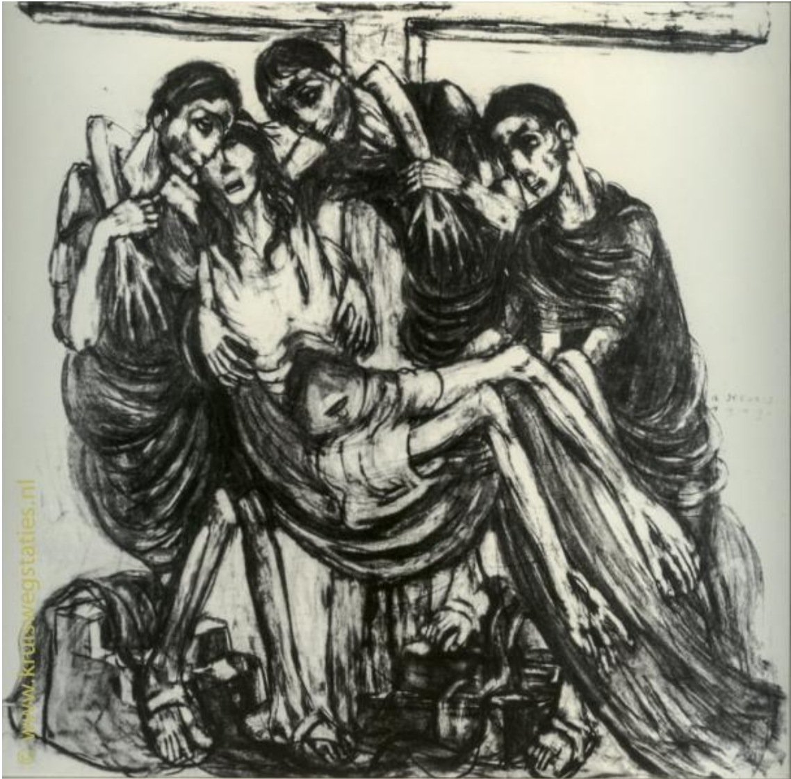
Imagem 13 – Décima Terceira Estação