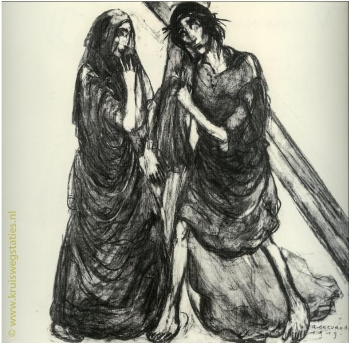
Imagem 4 – Quarta Estação