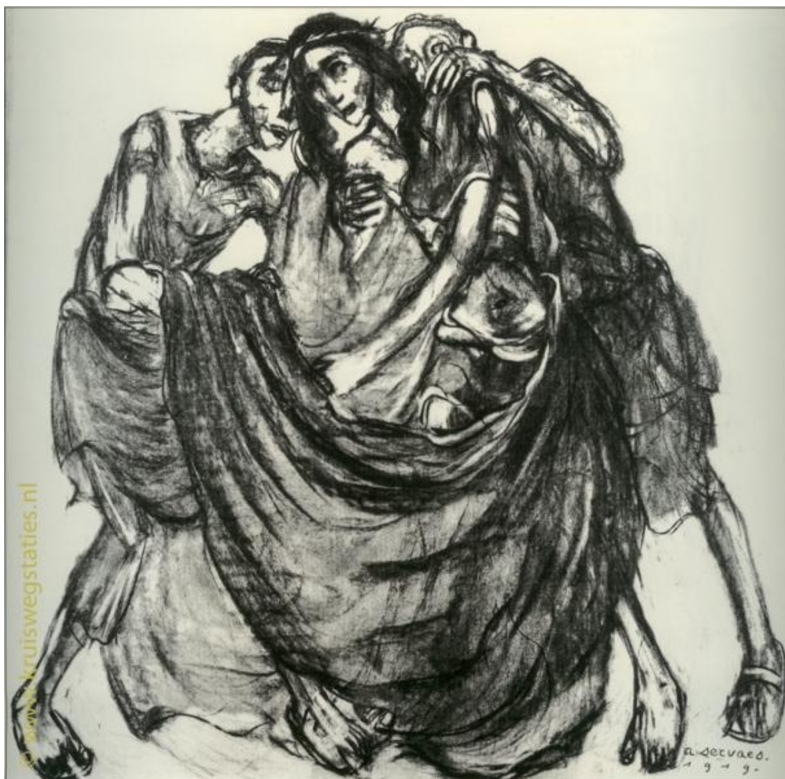
Imagem 10 – Décima Estação