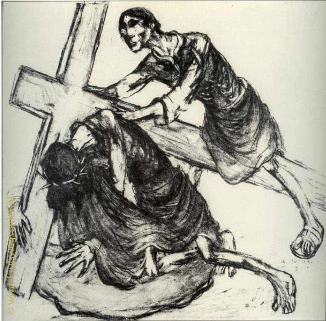
Imagem 7 – Sétima Estação