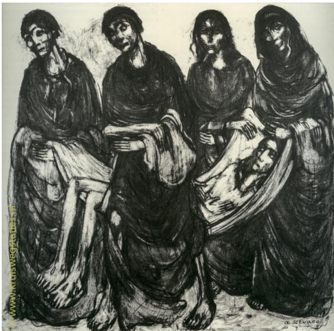
Imagem 14 – Décima Quarta Estação