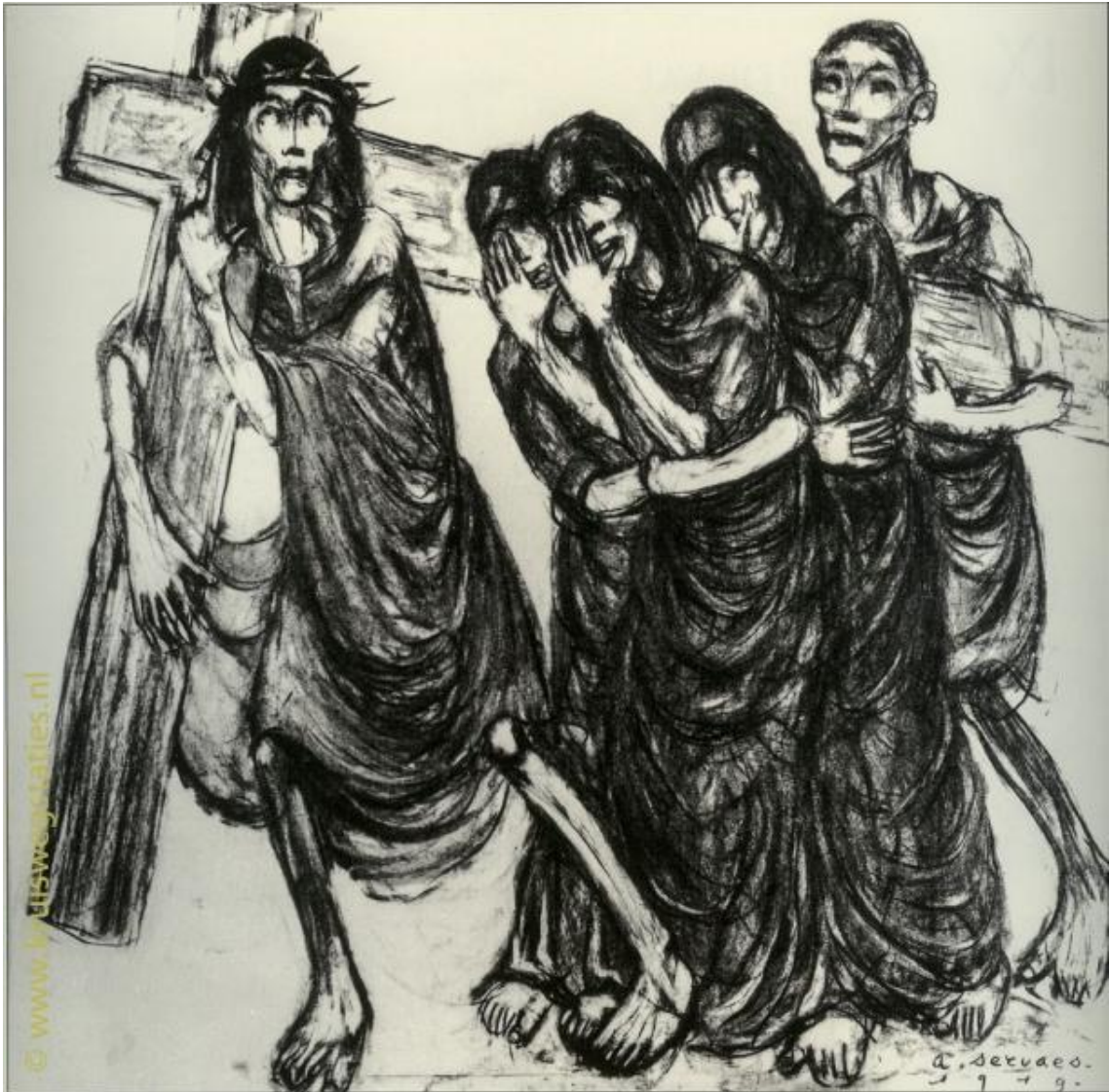
Imagem 8 – Oitava Estação