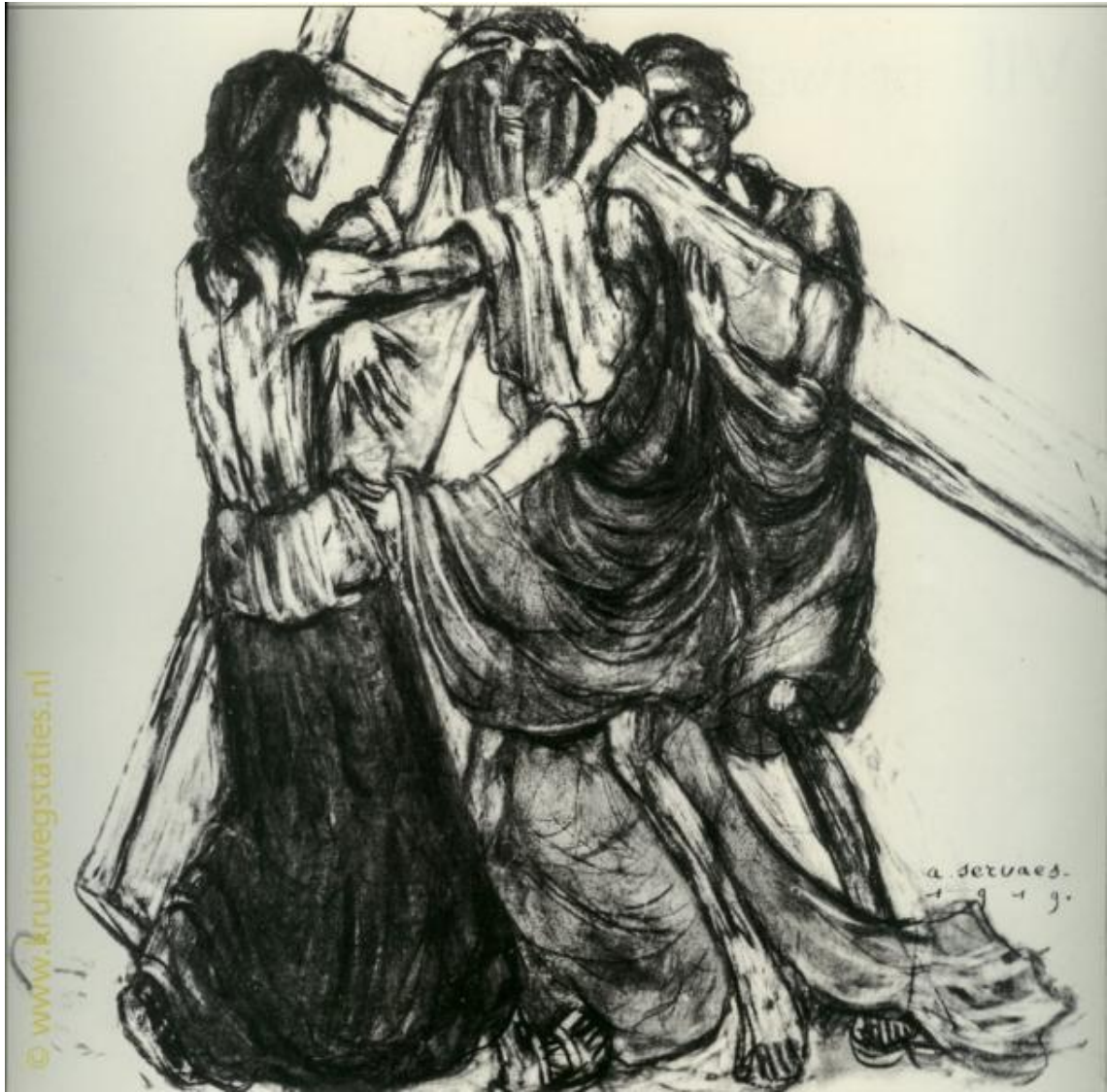
Imagem 6 – Sexta Estação