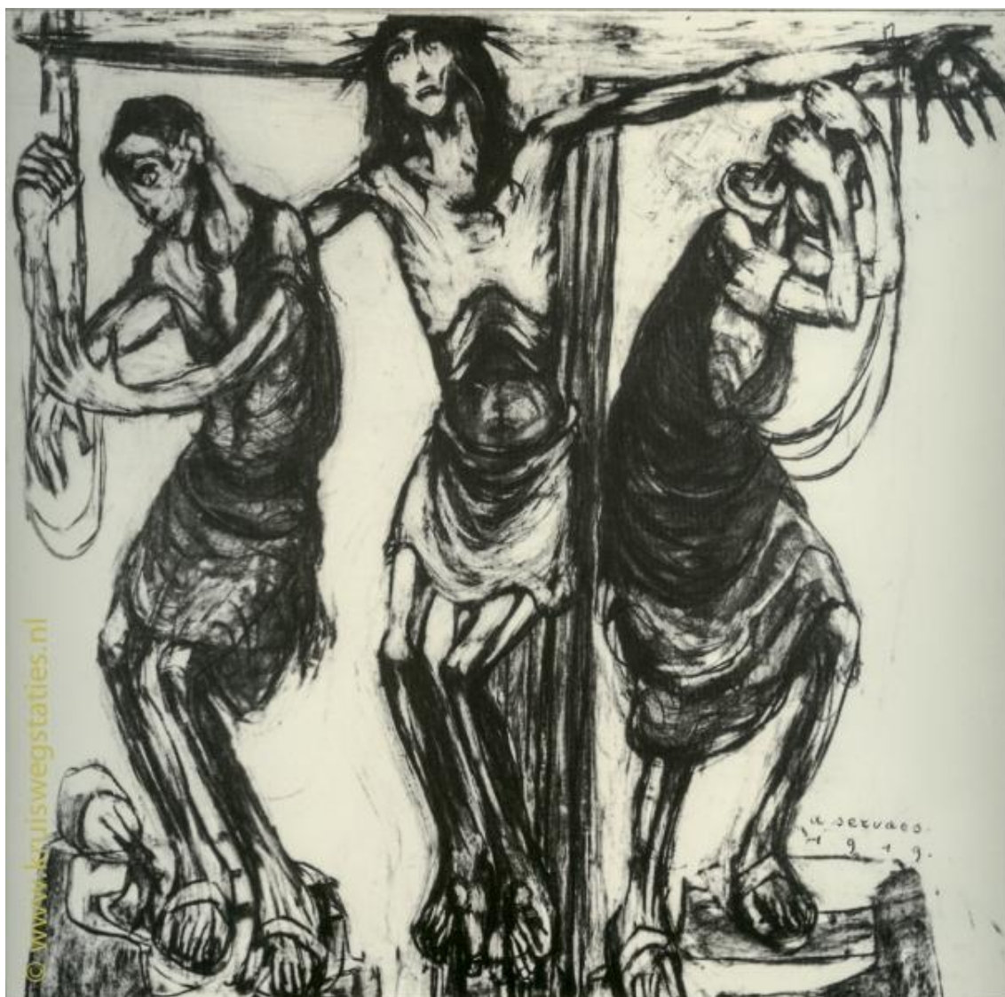
Imagem 11 – Décima Primeira Estação