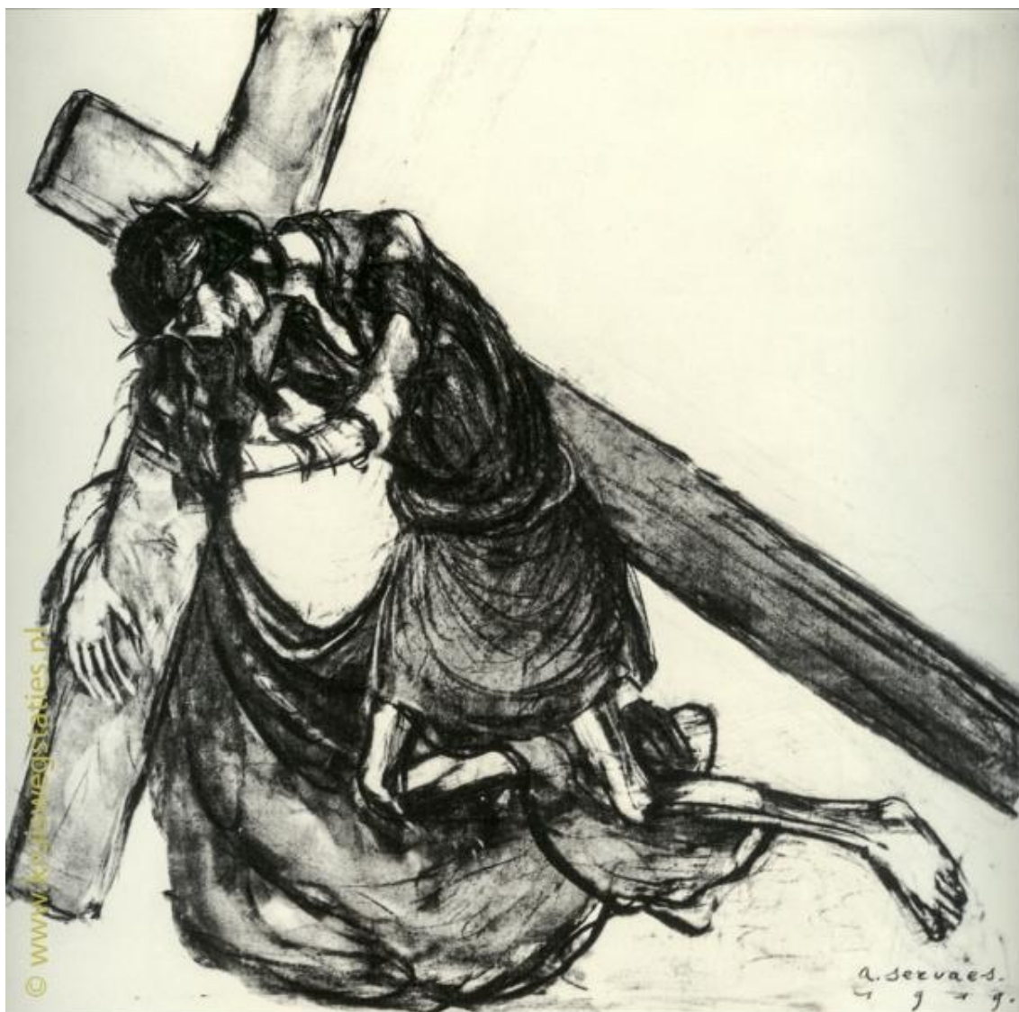
Imagem 3 – Terceira Estação