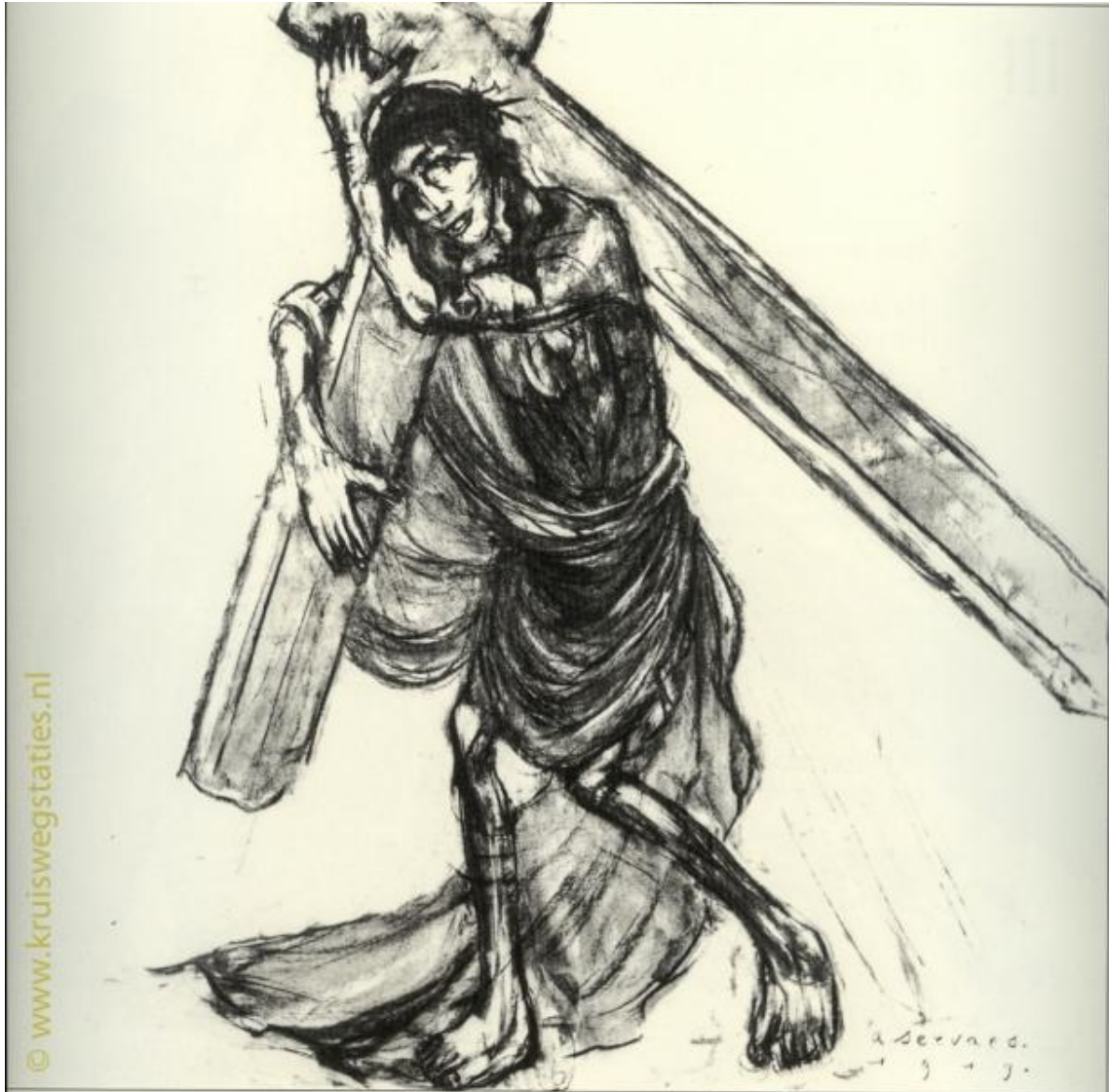
Imagem 2 – Segunda Estação