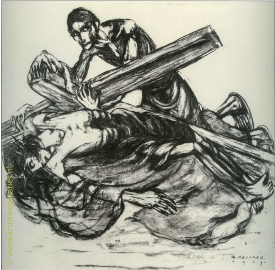
Imagem 9 – Nona Estação