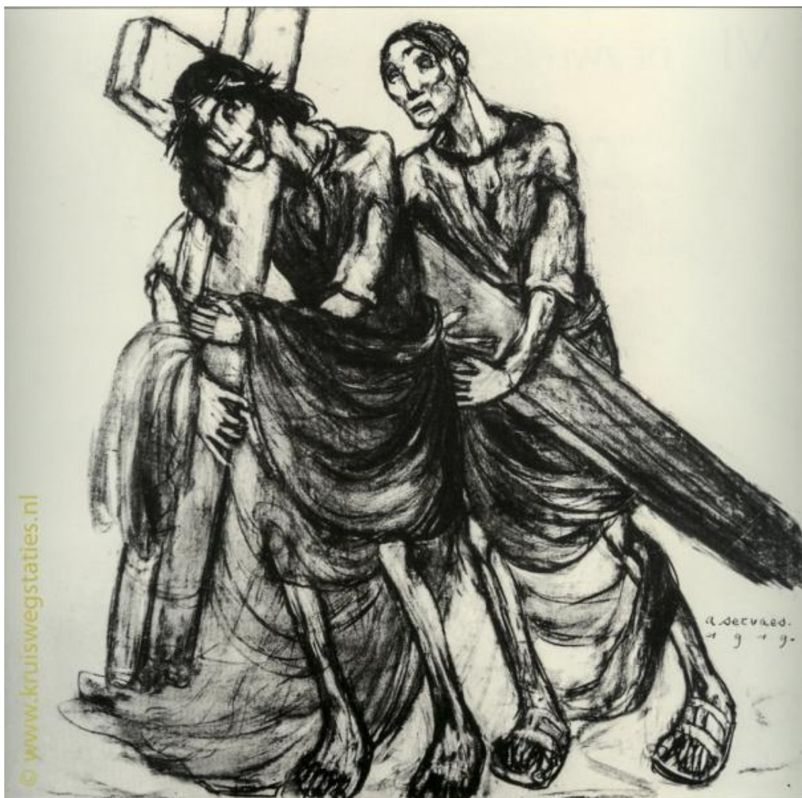
Imagem 5 – Quinta Estação