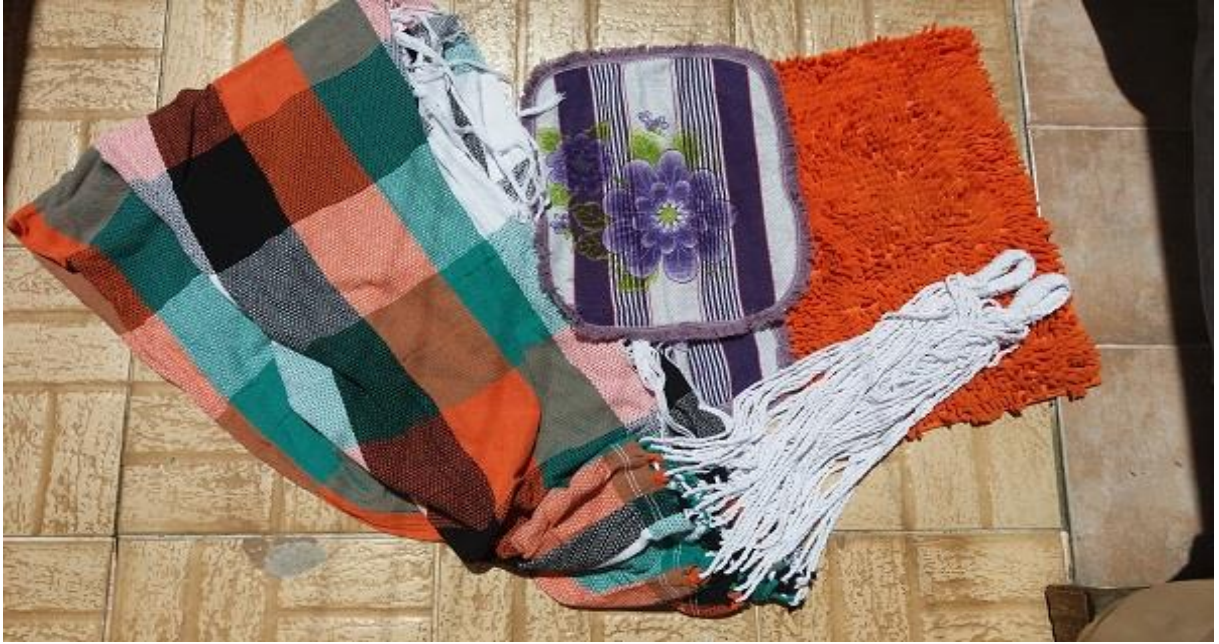
Figura 2 - Exemplares de rede e tapetes produzidos nas tecelagens nordestinas.

disponível no galpão para ele revender. Mas sempre nos carrinhos dos redeiros lá estavam as famosas redes, os tapetes, as mantas de sofá legítimas das tecelagens. Seguem as fotos de alguns exemplares dos objetos produzidos nas tecelagens nordestinas e as mantas que provavelmente são fabricadas no Chile: