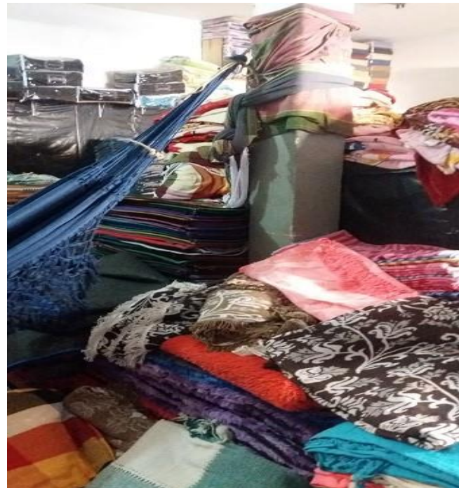
Figura 4 - Objetos do circuito empilhados no galpão do distribuidor.