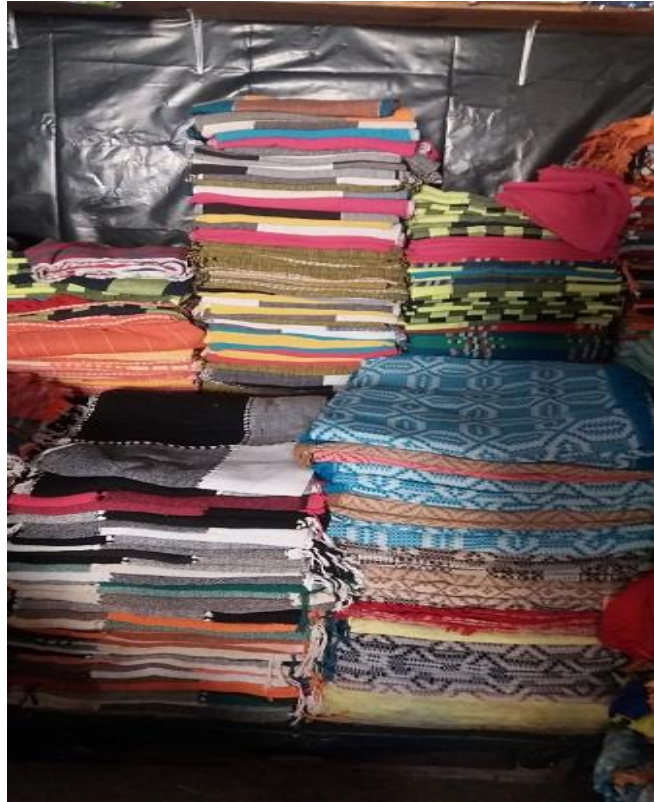
Figura 3 - Objetos do circuito empilhados no galpão do distribuidor.