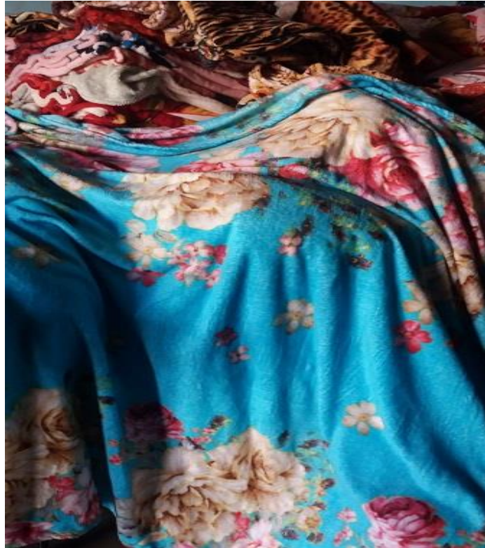
Figura 5 - Manta provavelmente produzida no Chile revendida pelos redeiros.