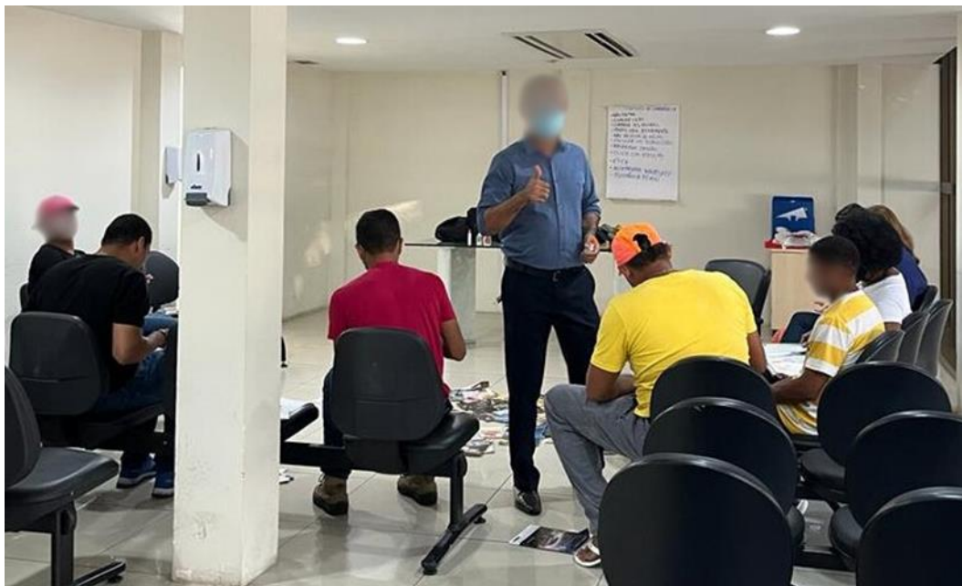
Fotografia 1 – Facilitador (de pé na foto), em atividade com os homens participantes do grupo observado (set. 2022 a abril de 2023)